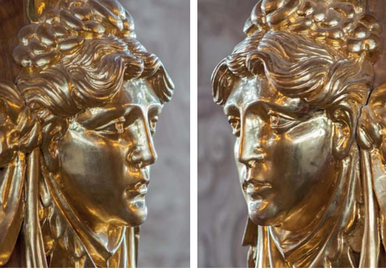
Aus Holz geschnitzte und mit Blattgold überzogene Maskaronen schmücken die beiden Hauptportale des Goldenen Saals.

heute: „Aristokrates“ – wohl ein Scherz des Restaurators, der diese Portalfigur rekonstruierte. Die rechte Nymphe (östlich) hält eine Kanne mit der originalen Inschrift: „Alles kommt vom Wasser“. Die damit im Goldenen Saal verherrlichte Augsburger Trinkwasserversorgung und Wasserkraftnutzung hat Denkmäler (auch aus der Zeit des Rathausbaus) hinterlassen, die 2019 von der UNESCO in die Welterbeliste aufgenommen wurden. Die Portal-säulen zieren beiderseits aus Holz geschnitzte und dann vergoldete Frauengesichter, sogenannte Maskaronen .