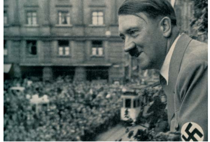
1935 winkte Adolf Hitler vom Balkon des Rathauses in die begeisterten Massen. Nur wenige Jahre später war die Stadt zerstört.

Als das Rathaus ausgestattet wurde, war der katholische Hardliner Ferdinand II. gerade an die Macht gekommen. Im Jahr seines Regierungsantritts – 1619 – wurde ein großer bronzener Reichsadler im Rechtecksgiebel an der Westfassade des Rathauses angebracht. An der Ostfassade stellte schon damals eine Wandmalerei den Adler dar. Heute erinnern an beiden Fassadenseiten gemalte doppelköpfige Adler an das Kaisertum der Habsburger.