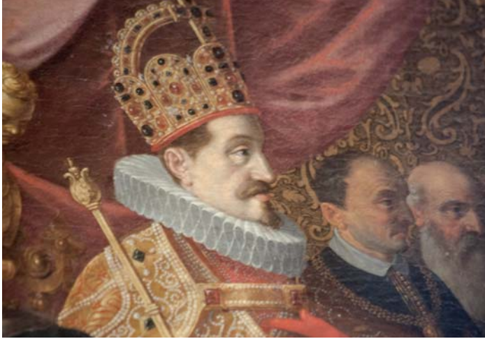
Ein Ölgemälde im südwestlichen Fürstenzimmer des Augsburger Rathauses verherrlicht die Vorzüge der Monarchie. Der Fürst trägt die Züge Kaiser Ferdinands II.

sind. Am linken Rand des Gemäldes mit der Devise „REX UNICVM ESTO“ („Sei du der König der Einzigartigen“) sitzt der gekrönte Fürst ebenfalls unter einem Baldachin. Er trägt die Gesichtszüge Kaiser Ferdinands II., der von 1619 bis zu seinem Ableben im Jahr 1637 im Heiligen Römischen Reich deutscher Nation herrschte.