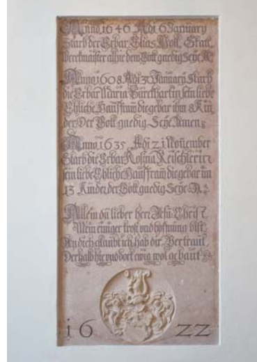
Im südlichen Treppenhaus sieht man das 1622 geschaffene Juramarmor-Epitaph für Elias Holl und seine Ehefrauen. In der Wandnische gegenüber steht eine Holl-Büste.

Auch an Tagen, an denen der Zugang zum Goldenen Saal durch das südliche Treppenhaus nicht möglich ist, lohnt