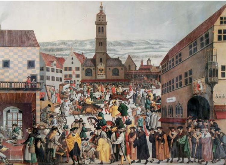
Ein nach 1511 gemaltes „Winterbild“ zeigt das gotische Rathaus und den Perlachturm.