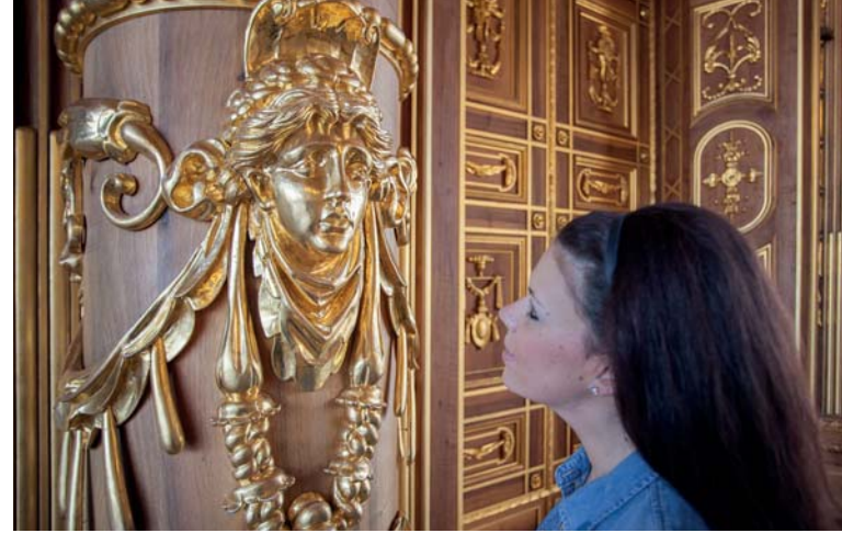
Auge in Auge mit einem der weiblichen Maskaronen am südlichen Hauptportal.

Ebenfalls aufwendig mit Maskaronen sowie etlichen weiteren geschnitzten und vergoldeten Dekorelementen verziert sind vier Nebenportale im Goldenen Saal, durch