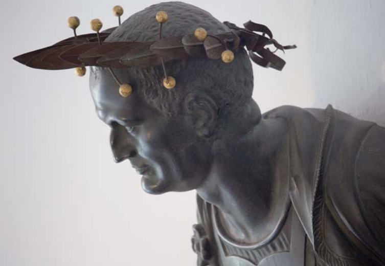
Das nördliche Treppenhaus des Rathauses zieren zwei weitere Bronzebüsten römischer Kaiser, darunter auch die des Vespasian.