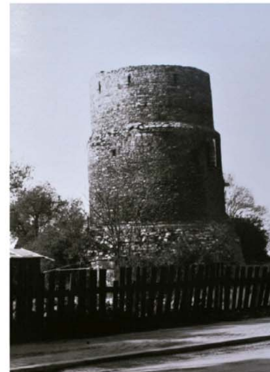
Alexanderturm 1944 und heute

Weitere Wassertürme waren in Mainz nicht erforderlich. Auch ein eigentlich in Raunheim für die Versorgung des Kreises Groß-Gerau geplanter Wasserturm wurde nicht mehr gebaut.