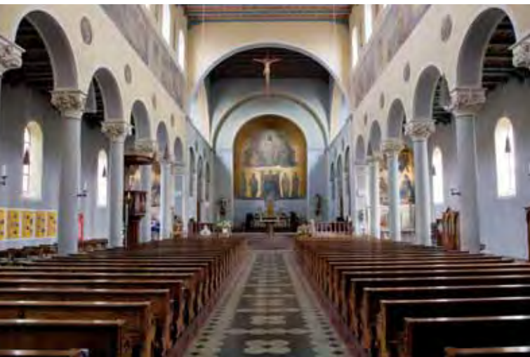
Das Innere der im Jahr 1871/72 im neoromanischen Stil errichteten Stadtpfarrkirche St. Jakob d. Ä.

Am östlichen St.-Jakobs-Platz überragt die bis 1872 errichtete (ab 1873 ausgestattete) originelle neoromanische Pfarrkirche St. Jakob die Stadt. Über die Jungbräustraße und die Bauernbräustraße – hier stehen die „gutbürgerlichen“ Häuser dieser Stadt – führt der Weg