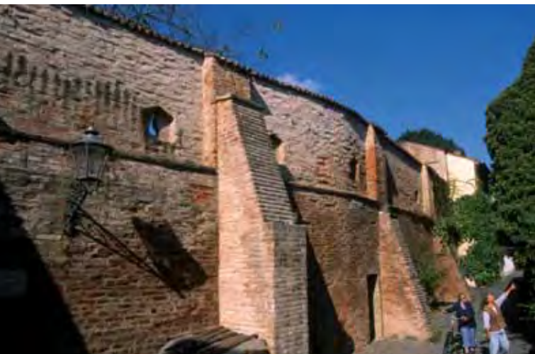
Im Westen und Nordwesten der Friedberger Altstadt ist die Stadtmauer weitgehend erhalten.

Am östlichen St.-Jakobs-Platz überragt die bis 1872 errichtete (ab 1873 ausgestattete) originelle neoromanische Pfarrkirche St. Jakob die Stadt. Über die Jungbräustraße und die Bauernbräustraße – hier stehen die „gutbürgerlichen“ Häuser dieser Stadt – führt der Weg