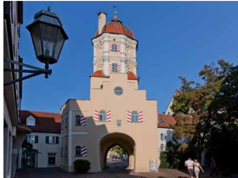
Bild oben: Auf dem Stadtplatz steht das barocke Aichacher Rathaus. Das Bauwerk entstand über dem zerstörten gotischen Vorgängerbau.

Die Obergeschosse des Oberen Tors wurden 1634 zerstört. 1697 erhielt dieses Stadttor am südlichen Ende des Aichacher Stadtplatzes den achteckigen Aufbau mit der barock geschwungenen Dachhaube.