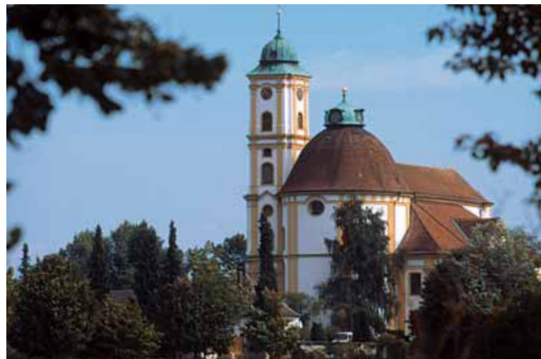
Der barocke Nordturm und die hohe Chorrotunde prägen das äußere Erscheinungsbild der katholischen Wallfahrtskirche Herrgottsruh im Osten der Altstadt.

in Richtung Stadtmauern und zu den verwinkelten Handwerker-gässchen, in denen die weithin bekannten Friedberger Uhrmacher des Barockzeitalters arbeiteten.