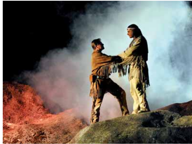
Bild oben: Winnetou bei einem seiner Abenteuer auf der Naturbühne in der Westernstadt in Dasing. Den Stoff für die Inszenierungen lieferte Karl May.

Der Apachenhäuptling und sein Blutsbruder Old Shatterhand stehen im Zentrum der „Süddeutschen Karl May-Festspiele“. Die Zuschauer fiebern auf überdachten, beheizbaren Tribünenplätzen mit.