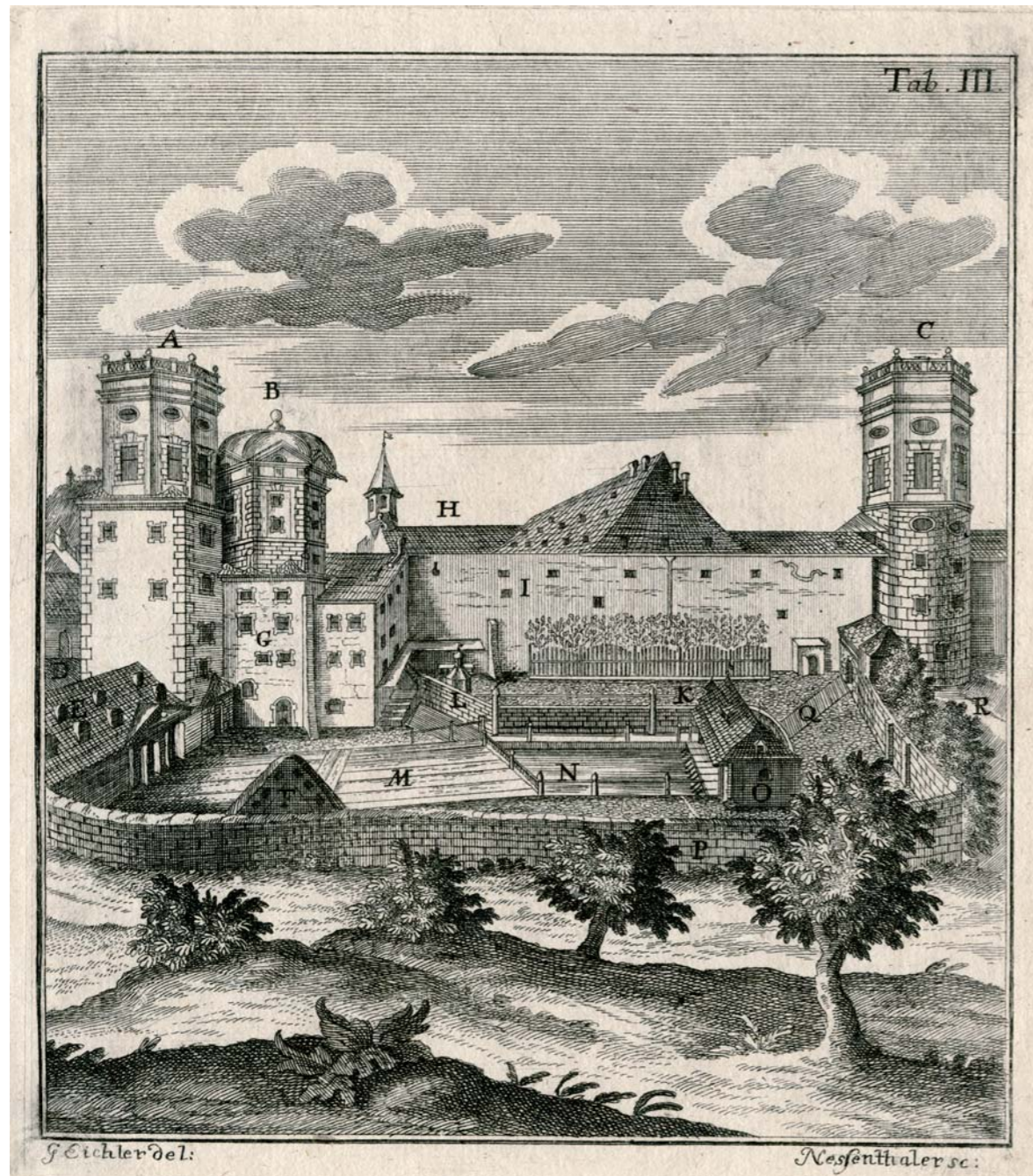
Das Obere Wasserwerk am Roten Tor nach seiner Erneuerung in den Jahren 1742 und 1743 durch den Brunnenmeister der Reichsstadt Augsburg, Caspar Walter. Nach einer Zeichnung des Stadtbrunnenmeisters entstand dieser Stich der Ostansicht des ältesten und größten Augsburger Wasserwerks, das in der Zeit von 1416/34 bis 1879 in Betrieb war. Abgedruckt wurde das Motiv in Walters 1766 in Augsburg erschienenem Werk „Anweisung vor einen jederweiligen Stadt=Brunnen=Meister in der des Heil. Röm. Reichs=Stadt Augspurg [...]“.